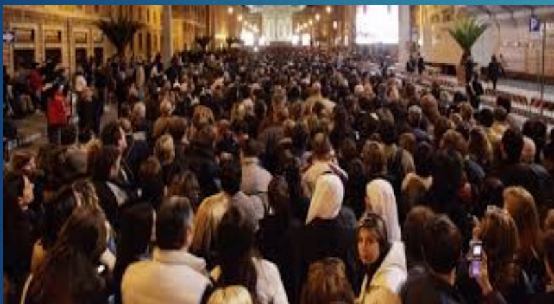
Pavens indsættelse 2005