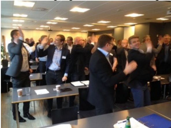
En god dag sluttet med High Five

Efter denne gennemgang fra direktøren sluttede en lang dag med generalforsamling og medlemsmøde, en som sagt lang dag, men spændende, og jeg er da nogenlunde sikker på at mange af deltagerne er gået hjem med noget de kunne bruge i deres virksomhed, og ud fra de henvendelser jeg efterfølgende har fået fra medlemmer, har de været meget godt tilfredse med dagen.