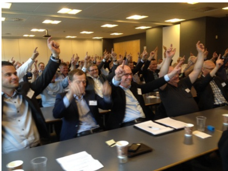
Vi har sejret og det fejres

Går vi dem igennem en for en, ser vi at 4 af dem er negative, overraskelse er både negativ og positiv medens kun en, glæde er positiv, så derfor er den det tankesæt vi skal have gang i.